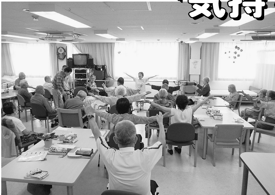
集団体操の様子。広く明るい室内でのびのびリハビリ