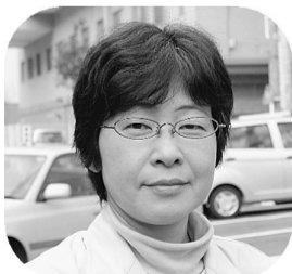
セカンドオピニオンについて

悪化する前に受診を 何らかの病気の原因になりうる歯周病が悪化する前に、軽度の歯周病なら半年に1度、もっと悪い方はきちんと治療を受けてから安定を保つ治療を1〜3カ月に1度受けることをお勧めします。