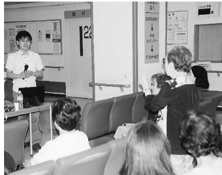
オールフレイルの待合室地域健康講座(2017年7月上田歯科医)