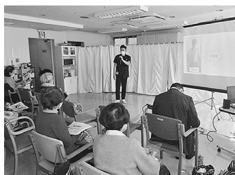
リハ部による「腰痛予防」体操

ること、人との交流の機会を増やすこと、そして、身体に異常があったらきちんと治療すること、定期的な健康チェック、健康診断、がん検診を受けて、早く見つけて、早期治療することが健康寿命をのばすこと