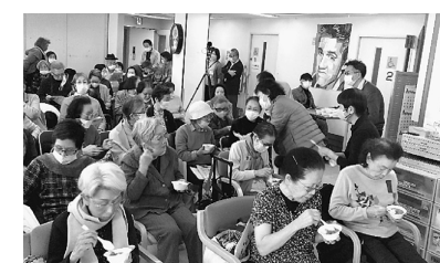
試食に「おいしい」と評判

「腰痛予防体操」でしりとり、腰痛は5人に一人が抱える国民病で、腰痛体操で、よりよい生活が送れるようにサポートして