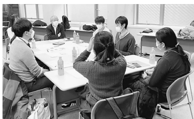
参加者とディスカッション