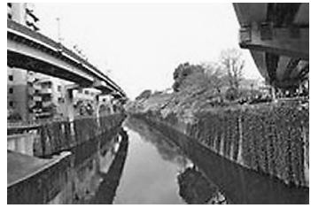
神田川沿いの遊歩道

早稲田大学正門から大熊庭園・肥後細川庭園へ 江戸川公園を神田川の遊歩道に沿って歩きます。新緑の葉が目を癒し、小鳥のさえずりが心地よく歩けます。街中ウォークの良さを再発見しませんか。 それぞれの公園の特徴を楽しみたいと思いませんか。 4月25日(木) 午後2時から代々木病院東館3階でおこないます。定員15名です。参加希望の方はご連絡下さい。