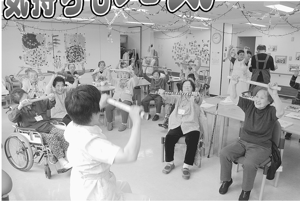
棒体操で今日も元気 (代々木病院・通所リハビリ室)

「むね、むね、まえ、むね、うえ、あたまのうしろ」今日も棒体操の時間がやってきました。代々木病院東館3階エレベーターを降りると目の前が通所リハビリ室です。ここは、介護保険の対象者で、申請後の認定調査で要支援や要介護と認定された方が通って来られる施設です。現在は登録のべ人数130人を超える利用者さんがいら