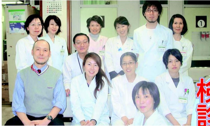
健康増進をサポートする検診センターのスタッフ

友の会が目指す「安心して住み続けられるまちづくり」も健康が基本です。健診センターでは、代々木健康友の会が取り組んでいる会員さんや地域の友の会検診(ドック、乳