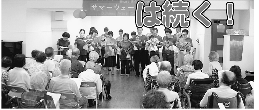
お客さまが50人以上いて緊張しました

7月27日(水)14時、三部合唱の「Stand Alone」(N 02号室の会場は、病棟の患者さまとご家族、通所リハビリの利用者さまをお迎えし、車椅子20台余、椅子席、立ち見も含め50人以上のお客さまの期待と熱気にあふれ、司会の第一声「みなさんこんにちはは〜も弾んでいました。」