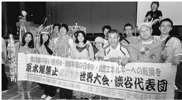
渋谷原水協の代表団

7日の開会総会のことがおきてから『核一フニング後、「今の兵器」の危険性に気づき、原水爆と同じように、取るのでは遅い。原水爆の戻りのつかない出来 故により放射能について』