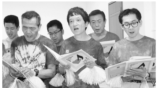
口を大きく開けて声を響かせました

7月27日(水)14時、三部合唱の「Stand Alone」(N 02号室の会場は、病棟の患者さまとご家族、通所リハビリの利用者さまをお迎えし、車椅子20台余、椅子席、立ち見も含め50人以上のお客さまの期待と熱気にあふれ、司会の第一声「みなさんこんにちはは〜も弾んでいました。」