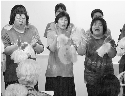
手拍子をして楽しく歌っています

コンサートでの準備では、6ヵ月以上前からメンバーがミーティングを重ねて曲目とコンサート名を決めました。また、合唱に参加しないメンバーにもポスター、歌詞カード、曲紹介と司会原稿作り、お客さま送迎のための車椅子操作の練習、当日の鮮な気持ちで楽しみながら歌い、聴いて下さった方に喜んでいただくことが、合唱の醍醐味です。