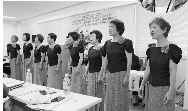
楽しくて美しい合唱を歌う合唱団・パンプー

伊香副会長より、2014年度決算の報告と2015年度予算が提案。会計監査報告では、会費納入率が低下しているのを、会費の納入を促進する対策が必要と指摘されました。