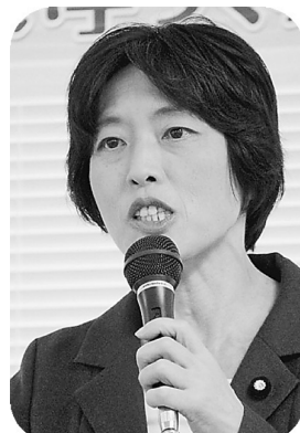
田村智子参議院議員

て確立しつつあります。無差別平等の医療包括ケアで、高齢者が安心して住み続けられる街づくりと、安心してかかる医療機関を目指して