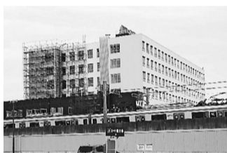
完成まじかの新病院