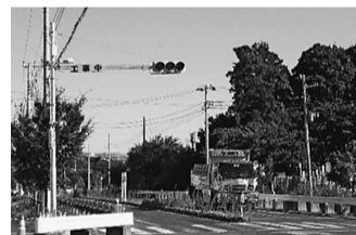
近くの道路に信号機ができました