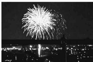
新病院から見た流山の花火大会

工事開始より1年10カ月、完成迫る建設は昨年1月20日に着工して1年10カ月が過ぎました。足場が外されつつありようやく完成が見えてきました。今後は、内装(床、壁、天井)や設備機器の設置等が中心に行われます。外構工事が進む中、正面玄関に配置予定の「シンボルツリー」をどうするか真剣に検討中です。