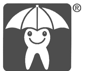
「歯に信頼」マーク。

も酸を排出しないため、虫歯の原因となりません。こうした食品には「歯に信頼」マークが付いています。が、お店で見つけるにはまだ商品が少ないようです。 「フッ素は歯の再石灰化を助ける」 次にフッ素は歯の再石灰化の手助けをする作用がありますので、現在ではほとんどの歯磨き粉に含まれています。また、子供の虫歯予防にも広く活用されています。しっかりと歯ブラシで歯垢を