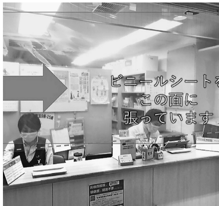
受付のカウンター

受付のカウンターに透明のビニールシートを取り付けています。シートを隔てることで飛沫感染の防止を図っています。