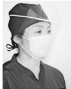
フェイスガード着用して治療

飛沫感染対策として、フェイスガードを着用して治療を行っています。これによりスタッフ側からも皆さんに唾液等が飛散しないようにしています。