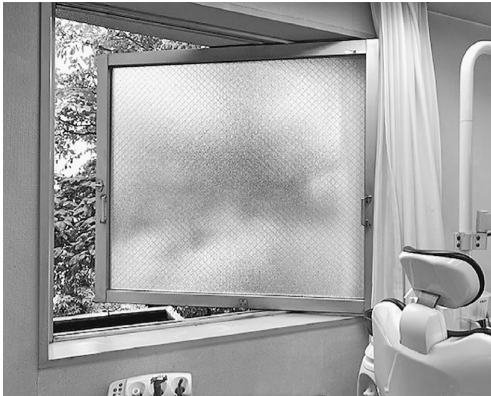
診療スペース・待合室も窓を開けて換気

に、建物に「コロナ感染対策実施中」の垂れ幕を掲げています。安心して受診していただけたらと思います。