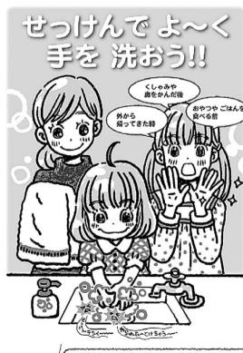
せっけんでよく手を洗おう!!

マスクをして飛沫を飛ばすことを抑えているならば、消毒は頻回でなくても大丈夫です。プラス