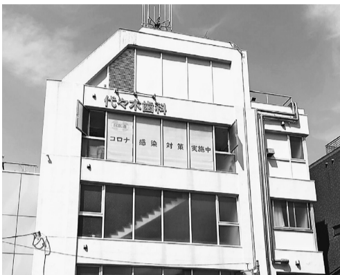
建物に「コロナ感染対策実施中」の垂れ幕