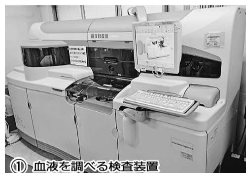
① 血液を調べる検査装置

などを調べる「検体検査」と、心電図や超音波検査など患者さんの身体を直接調べる「生理機能検査」です。 まず「検体検査」ですが、血液検査では、肝機能や腎機能・脂質・血糖・甲状腺ホルモン・血液型を調べたり、赤血球・白血球・血小板などの血球数の算定をして、貧血や炎症の程度を把握します。採尿検査では、糖や蛋白質・赤血球・白血球・比重・PHを試験紙で調べたり、遠心して沈殿した細胞や血球、細菌を顕微鏡で観察します。また、便の中に血液が混ざっていないかを見る便潜血の検査もあります。 「生理機能検査」では、心電図から不整脈や心臓の虚血の状態、狭心症や心筋梗塞を起しているかを調べる検査装置 ② 不整脈、心臓の虚血の状態、狭心症などを調べる心電図検査 ③ 高周波の音を身体にあて、音の反射を利用して映し出す超音波検査