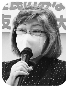
中垣さんが特別決議を

続いて、決算の報告、会計監査の報告、予算の提案がおこなわれ、質疑、討論をおこないました。