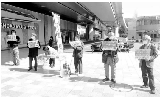
武力攻撃に厳しく抗議