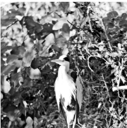
カワセミに会えるかも

埋立地に蘇った野鳥の楽園。いろいろな小鳥のさえずりが聞こえる小道を歩きます。観察小屋でもしかしたらオオタカやカワセミに会えるかもしれません。寒くて閉じこもりがちの日々ですが、いっしょに運動不足を解消します。