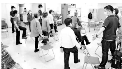
本年も「地域の方々を元気に♪」

本年もよろしくお願いたします。第4回「膝・腰に効く！ホームエクササイズ」が3月7日(土)に開催されます。前回は25名の方々に参加いただき、膝・腰に関するセルフチェック・講