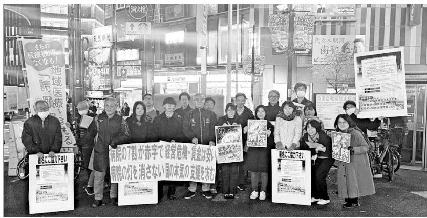
代々木駅前での「地域医療守れ」宣伝行動

会費納入のご案内 会費納入は、郵便振替が便利です。 会費は年間1,000円です。 口座番号 00190-7-71019 加入者名 代々木健康友の会 2月1日現在の会員約3,082人