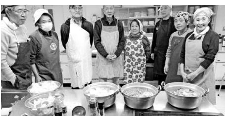
女性の参加も歓迎です！

1月10日(土)の男の料理教室は、9名の参加でした。レシピは「塩ちゃんこ」と「寄せ鍋」と「キムチ鍋」の3種類の鍋を作りました。