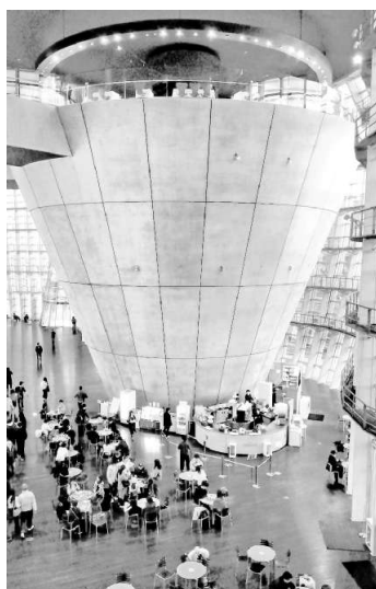
新国立美術館の空中カフェ